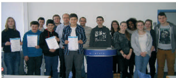
Zertifikatsübergabe bei der quindata GmbH

Finanziert wird BASE MINT aus Mitteln der Stadt Kassel, der Agentur für Arbeit sowie der quindata GmbH und der plentymarkets® GmbH Kassel.